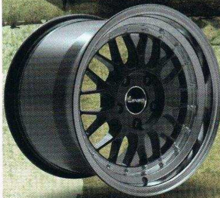
Le Mans B9