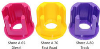
Shore A 65 Diesel Shore A 70 Fast Road Shore A 80 Track

Die beliebten Powerflex Einsätze für die Drehmomentstütze am Motor gibt es nicht nur in der Neuen ab Bj. 2008 benutzten Ausführung, nein, sie ist ab sofort sogar in 3 verschiedenen Härtegraden je nach Einsatzzweck bzw. Motorvariante lieferbar!