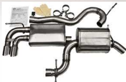
APR RSC Auspuffanlage in Vorbereitung