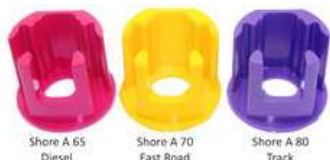
Shore A 65 Diesel Shore A 70 Fast Road Shore A 80 Track

Die beliebten Powerflex Einsätze für die Drehmomentstütze am Motor gibt es nicht nur in der Neuen ab Bj. 2008 benutzten Ausführung, nein, sie ist ab sofort sogar in 3 verschiedenen Härtegraden je nach Einsatzzweck bzw. Motorvariante lieferbar!