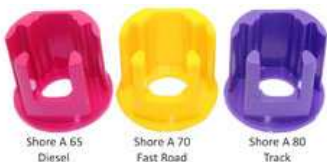
Shore A 65 Diesel