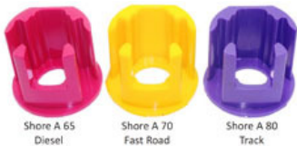
Shore A 65 Diesel Shore A 70 Fast Road Shore A 80 Track

Die beliebten Powerflex Einsätze für die Drehmomentstütze am Motor gibt es nicht nur in der Neuen ab Bj. 2008 benutzten Ausführung, nein, sie ist ab sofort sogar in 3 verschiedenen Härtegraden je nach Einsatzzweck bzw. Motorvariante lieferbar!