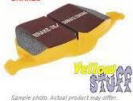
Sample photo. Actual product may differ.